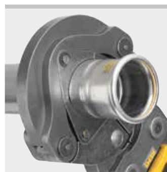
REMS lisovací kroužek (PR-3S)