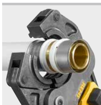
REMS lisovací kleště (S)