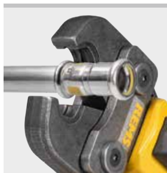
REMS lisovací kleště