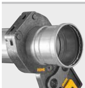
REMS lisovací kroužek (PR-3B)