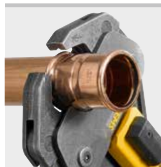
REMS lisovací kleště (4G)