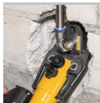
REMS lisovací kroužek 45° (PR-2B) Patent EP 2 774 725